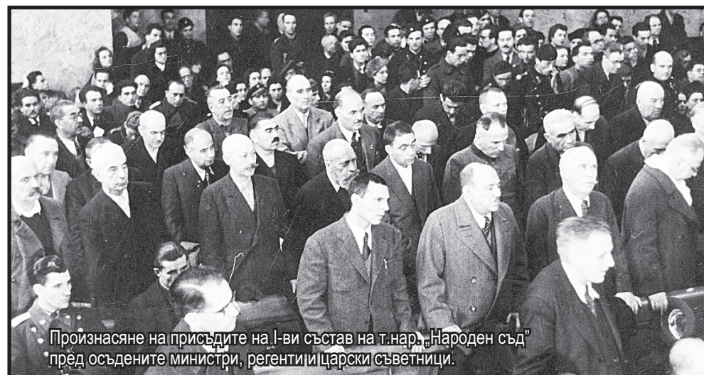
Произнасяне на присъдите на 1-ви състав на т.нар. „Народен съд“ пред осъдените министри, регенти и царски съветници.

Върху многото, подредени една зад друга пейки седяха подсъдимите, общо сто шестдесет и двама. Те представляваха най-знаменитата подсъдима скамейка, която някога е съществувала в цялата история на правосъдието.“