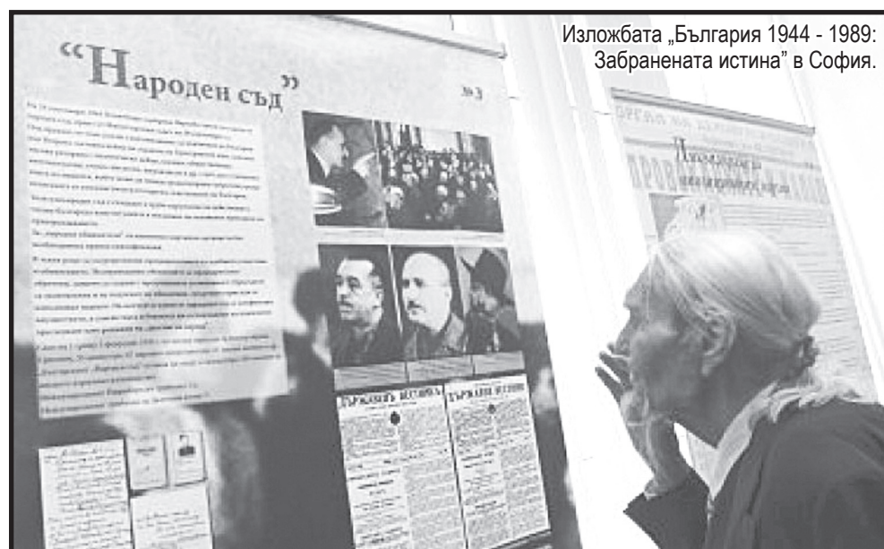
Изложбата „България 1944 - 1989: Забранената истина“ в София.

Каква „правна“ лексика, какъв „морал“...