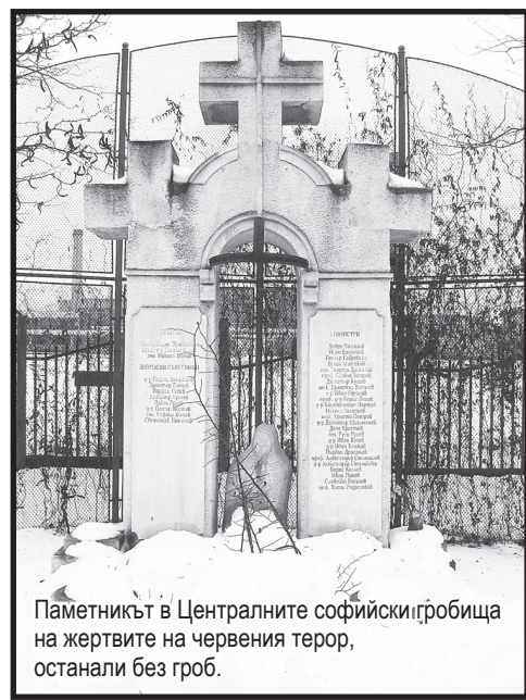
Паметникът в Централните софийски гробища на жертвите на червения терор, останали без гроб.

„Голямото избиване на хора бе започнало – пише Бретхолц по повод масовата екзекуция на българските държавни мъже и продължава: То нямаше да приключи преди във всеки град и във всяко село да бъде унищожена и последната свободомислеща личност, която би застрашила със своя авторитет и демократични позиции установяването на комунистическата диктатура.“